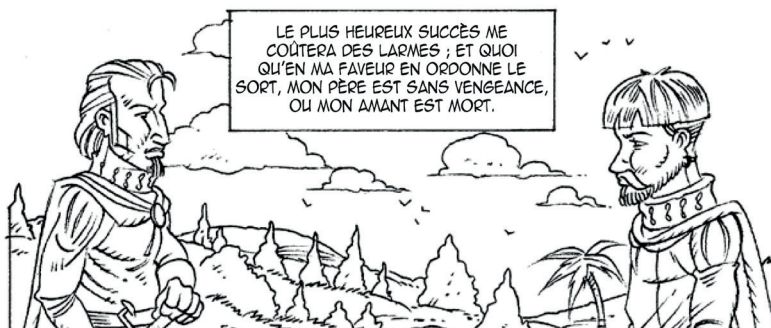
La planche ancree et mise en page