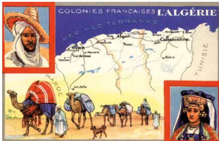
Carte postale de l'Algérie française.