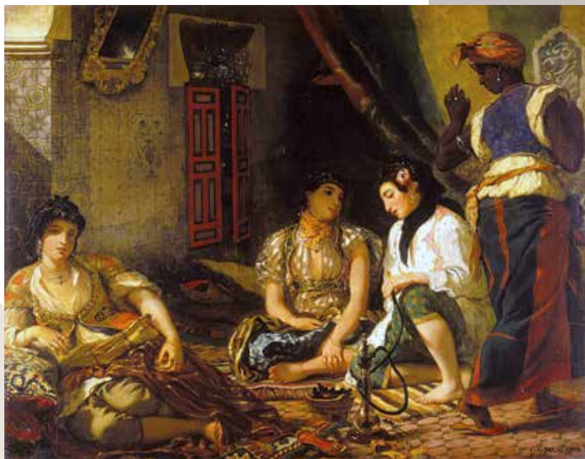
Eugène Delacroix, Femmes d'Alger dans leur intérieur, 1834

La biographie édifiante d'un maréchal de France ayant construit sa carrière sur la conquête de l'Algérie. François Maspéro. Éditions Seuil