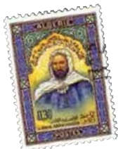
Timbre à l'effigie de l'émir Abd el-Kader, principal résistant aux troupes françaises.

Le maréchal Thomas Bugeaud, l'homme de la conquête.